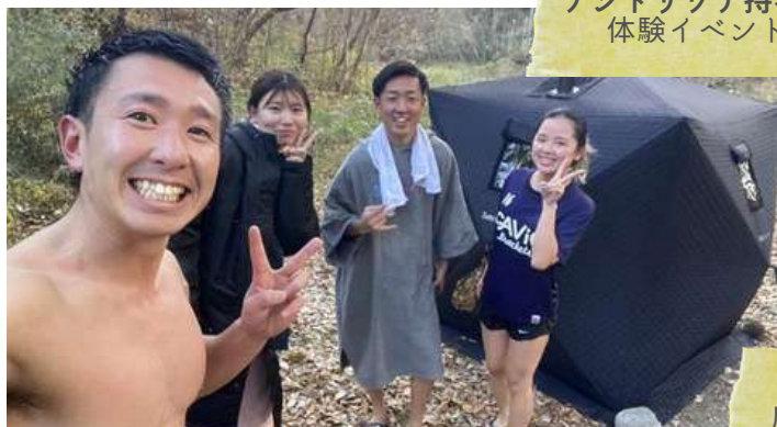
テントサウナ持参で 体験イベント