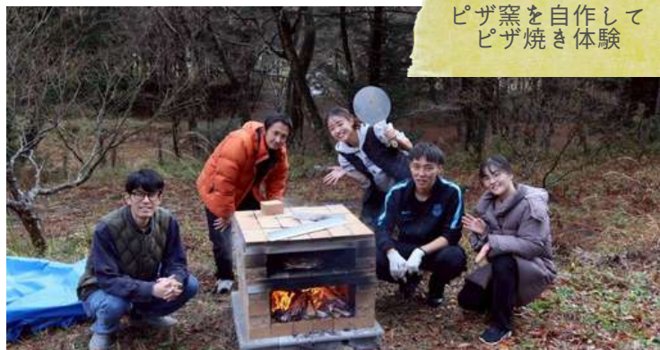
ピザ窯を自作して ピザ焼き体験